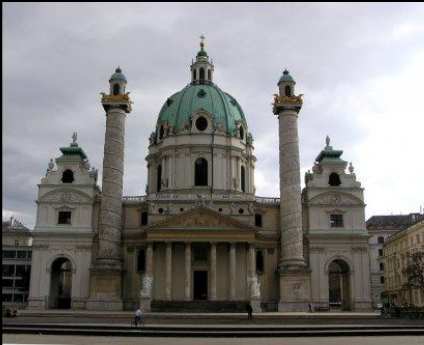
Bécs, Karlskirche Az építés kezdete 1716